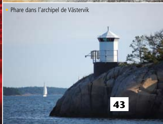
• Phare dans l'archipel de Västervik