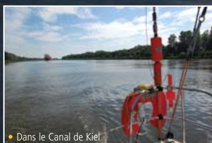
• Dans le Canal de Kiel

Il n'est sans doute pas utile de s'éterniser en Allemagne, ni même au Danemark, ses côtes basses