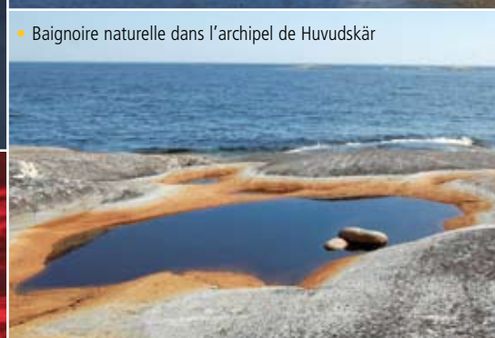
• Baignoire naturelle dans l'archipel de Huvudskär