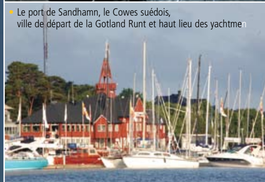
• Le port de Sandhamn, le Cowes suédois, ville de départ de la Gotland Runt et haut lieu des yachtmen