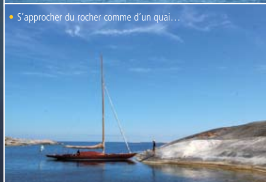
• S'approcher du rocher comme d'un quai...