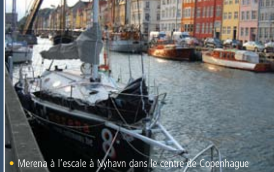
• Merena à l'escale à Nyhavn dans le centre de Copenhague